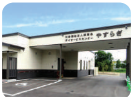
ディサービスセンターやすらぎ 通所介護(1日型・半日型)