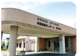
特別養護老人ホーム花もみじ 地域密着型特別養護老人ホーム