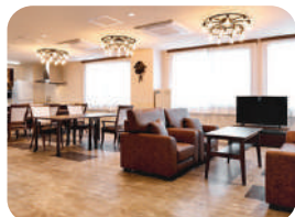
グループホーム風ぐるま グループホーム