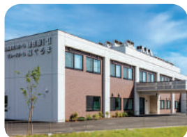
特別養護老人ホーム緑樹園 I・II 特別養護老人ホーム・ショートステイ