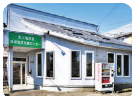
若小牧市西地域包括支援センター 地域包括支援センター