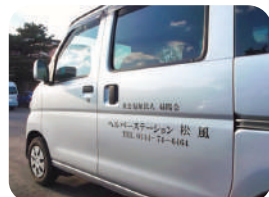
ヘルパーステーション松風 訪問介護