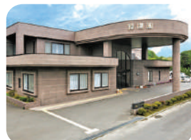
特別養護老人ホーム緑陽園 特別養護老人ホーム・ショートステイ・給食宅配