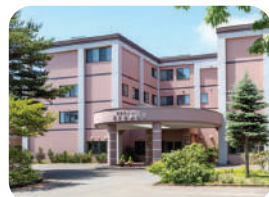
養護老人ホーム 若小牧静和荘 養護老人ホーム・特定施設入居者生活介護・ ショートステイ