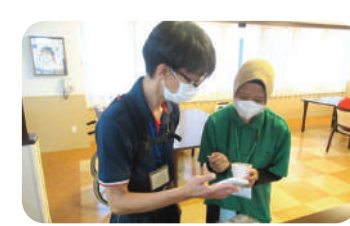
●AI翻訳機「ポケトーク」の導入