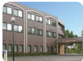
介護老人保健施設みどりの苑 介護老人保健施設・ショートステイ・ 通所リハビリテーション