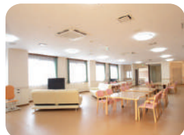
ディサービスセンター松風 通所介護