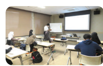
●日本語フォローアップ研修の開催

▼緑陽会ではたらく外国人職員 ※2025年1月現在 ベトナム:2名 韓国:1名 インドネシア:10名 ネパール:1名