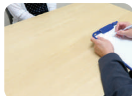
居宅介護支援事業所緑陽 居宅介護支援事業所